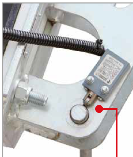
Micro di sicurezza Safety microswitch